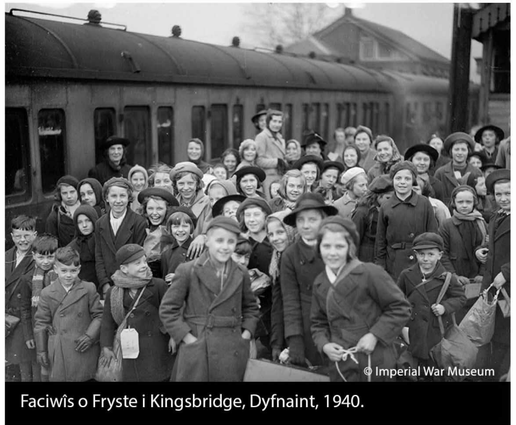
Faciwis o Fryste i Kingsbridge, Dyfnaint, 1940.

Yn ystod y rhyfel, roedd bron pawb yn gadael yr ysgol yn 14 oed ac aeth y rhan fwyaf yn syth i waith llawn-amser. Wrth droi'n 18 oed, byddech chi'n cael eich galw i gynorthwyo gydag ymdrech y rhyfel – bechgyn i'r lluoedd arfog, merched i waith pwysig megis Awyrlu Ategol y Menywod.