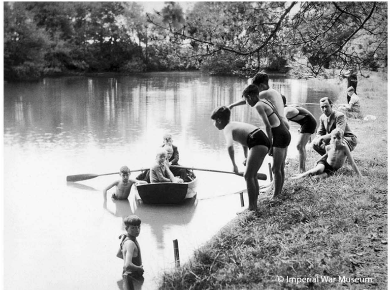
Faciwîs o Lundain yn Sir Benfro, Cymru, 1940.

Darllenwch eu straeon ac atebwch y cwestiynau.